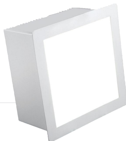
BLE/Q - 500/L SE