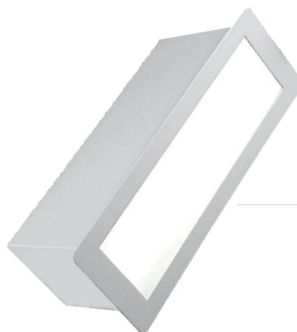
BLE/R - 500/L SE